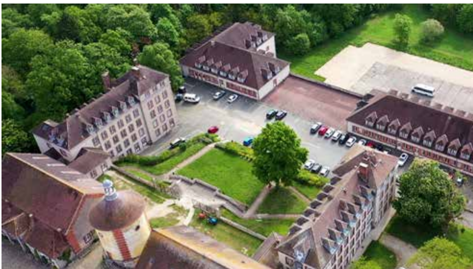
Le Pôle formation, en contrebas du colombier et des granges royales.

Le Bac Pro CGEH attire de nombreux candidats; en effet, ce cursus est très apprécié car il permet de développer des compétences agricoles, des acquis professionnels mais aussi de progresser à cheval.