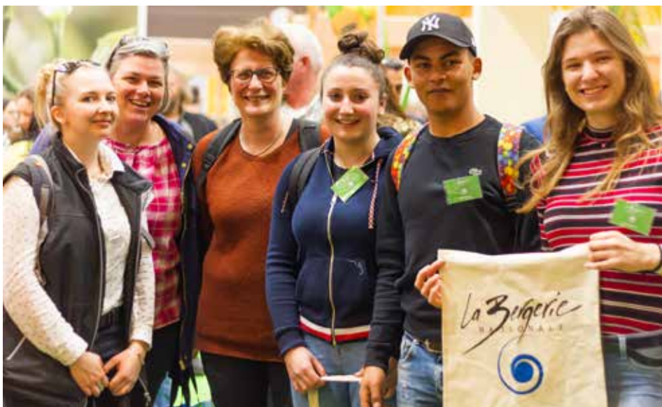
Des apprenants BTS PA, BTS Acse et Licence Pro PA enquêteront auprès du public et des acteurs du monde agricole.