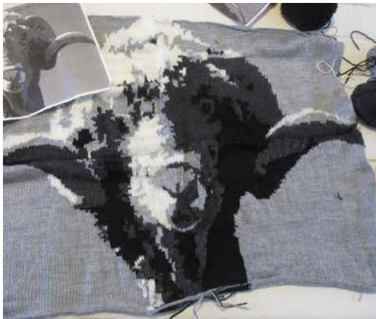
Tête de mouton Mérinos réalisée par l'association du personnel de la Bergerie.