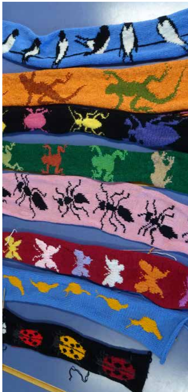
« Les petites bêtes de laine » courent, volent, rampent en 2020!