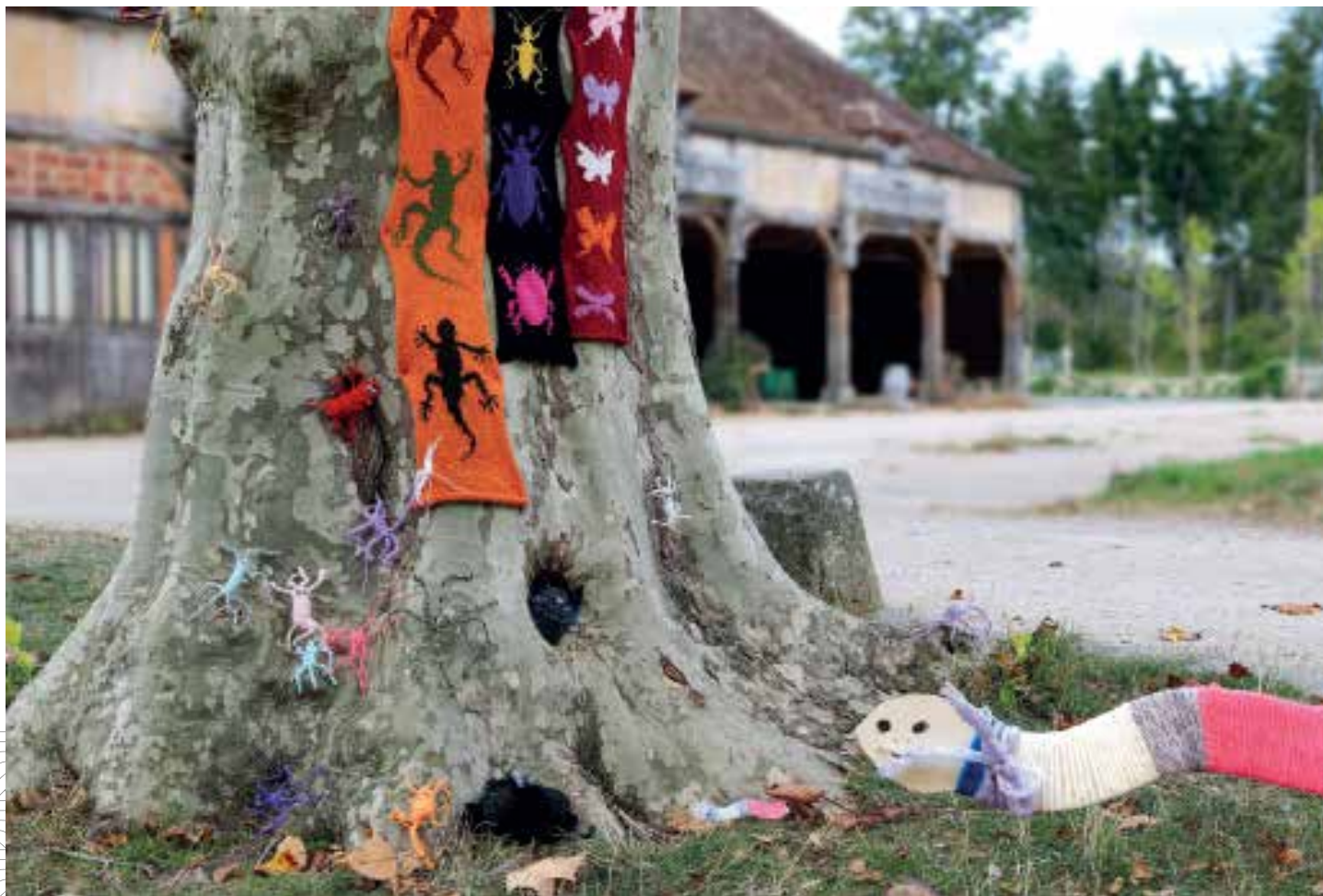
Les petites bêtes de laine, thème 2020 de Créati'laine.

D'autres structures sont engagées dans le projet, elles ont jusqu'à mi-mars 2020 pour préparer et terminer leur travail.