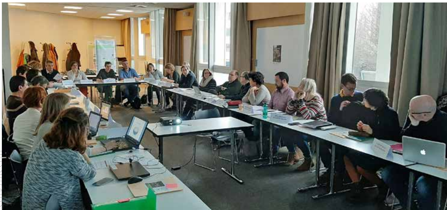
40 participants au séminaire de clôture du dispositif EDUC'Ecophyto en février à Paris.

Au total 14 filières de formation (BTS, Bac Pro, ingénieurs agronomes, Bac technologique et filières générales) et plus de 50 classes ont été impliquées dans le projet