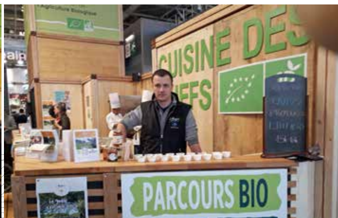
En 2019 déjà, la Bergerie nationale répondait aux questions sur l'agroécologie et présentait ses produits.