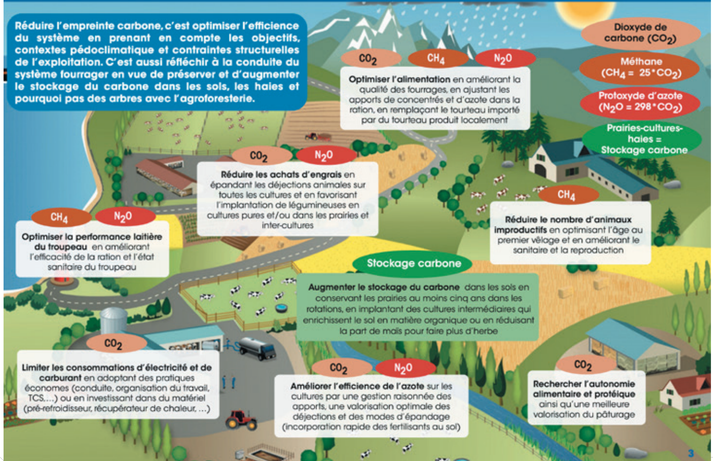
Exemple de ressource de la boîte à outils : les leviers d'action pour réduire les 3 gaz à effet de serre (dioxyde de carbone, méthane et protoxyde d'azote).