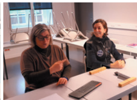
Quelques instantanés de la journée du 29 janvier.

l'occasion de présenter les nouvelles formations (Acaced, TAV chiens/chats).